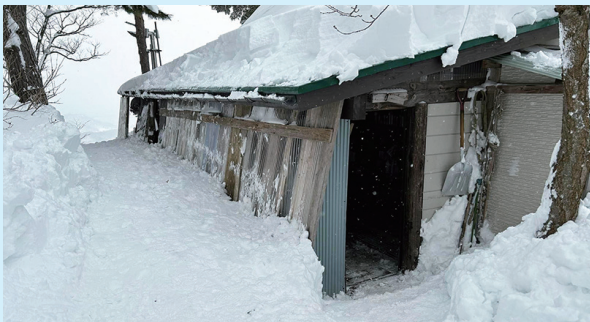
やっと山小屋の中に入れます。お疲れさまです!!