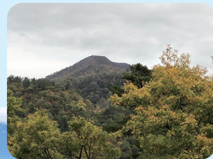
ハチカ沢登山口からの甑岳