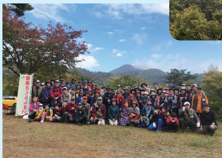
参加者全員で記念撮影