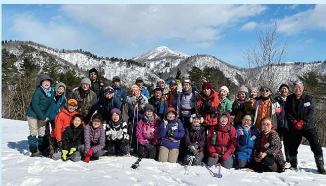
最高の天気でした!

令和5年2月25日(土)、参加者25名、スタッフ5 名の計30名で、新型コロナウイルス感染症拡大防止 対策に配慮し、開催しました。