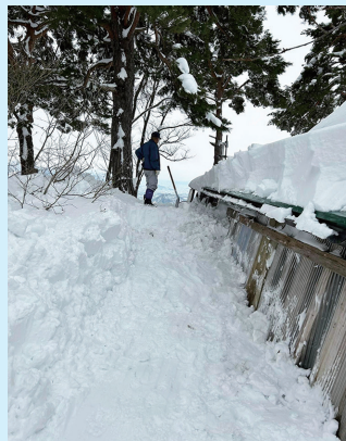
山小屋の屋根の高さまで 雪が積もっていました。