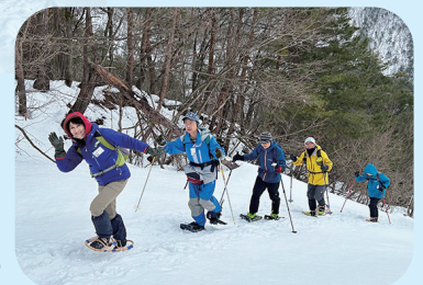
天気良くて 足も軽やか!?