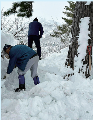
山小屋のまわりの 雪かき風景