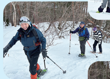
坂道でも思わず 笑顔になっちゃう!?